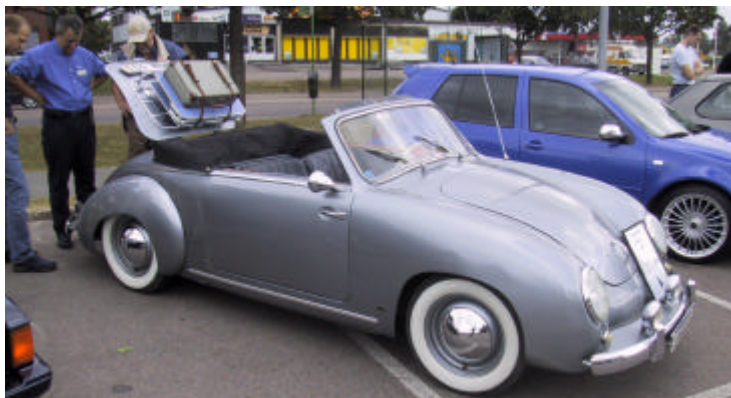
[ en mycket ovanlig Dannenhauer & Stauss från 1953 ]

Förutom provkörning av R32:an hade vi under dagen möjlighet att provköra Volkswagens övriga prestanda-modeller. En 'Finaste Bil' tävling gick av stapel med ett otroligt fint förstapris, en resa till Autostadt. De som ville prova något annat kunde testa laserbaserad lerduve-skjutning. Sist men inte minst fick vi lyssna på ett föredrag om R32:an.